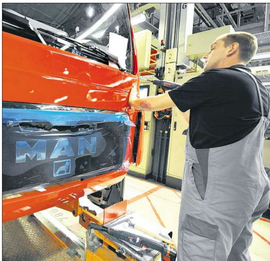
AUCH BEI DEN NUTZFAHRZEUGEN spüren die großen Hersteller eine Belebung. Die steigende Nachfrage bei den Lkw werten Experten als Konjunkturindikator.