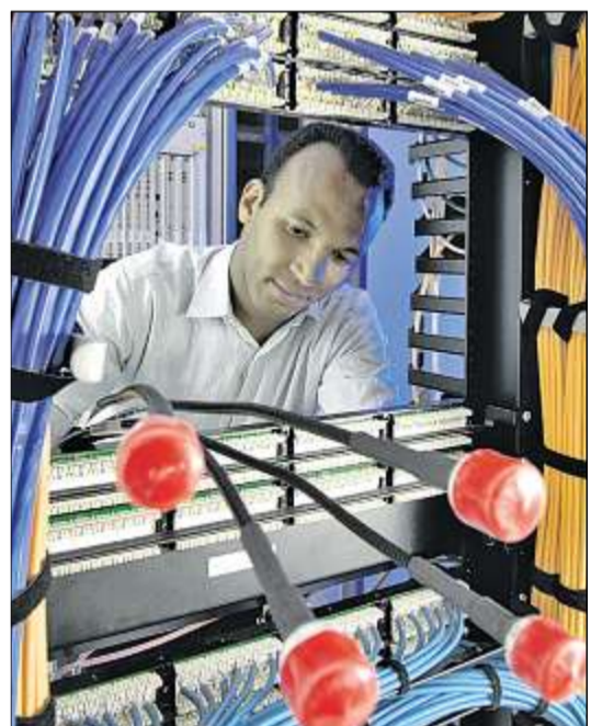
EIN INGENIEUR von Spie überprüft ein komplexes Datennetzwerk.